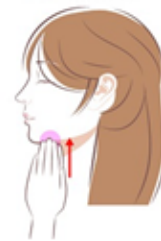
がつかせん 顎下腺