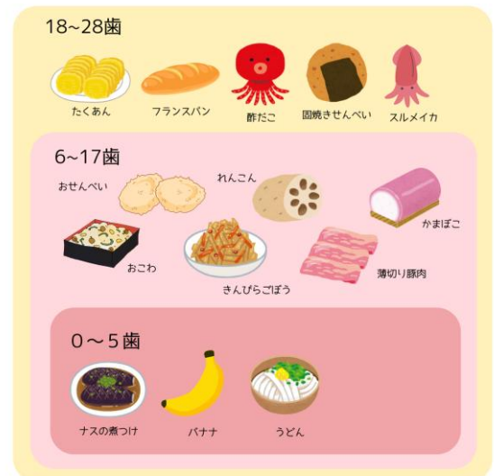
おいしく食べられる歯の本数